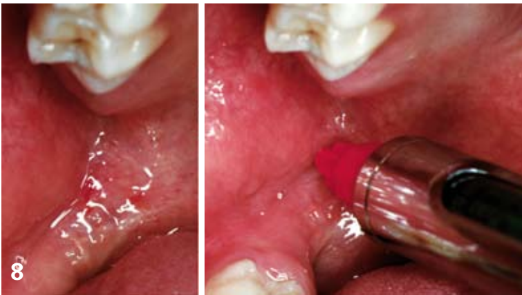
8. Anesthésie loco-régionale à la lingula . Il est aisé de repérer le sommet de l'angle du raphé ptérygo-mandibulaire, bouche grande ouverte. L'injection, traçante, se pratique en un seul temps, le corps de la seringue orienté sur la zone contralatérale mandibulaire.